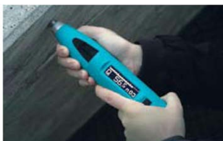
...pri svim uglovima