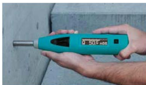
Na betonskim zidovima, platformama i stubovima