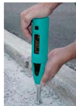
na mekom betonu (sa pečurkastim dodatkom)